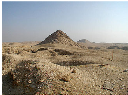
Vue de la pyramide d'Ouserkaf - V e dynastie