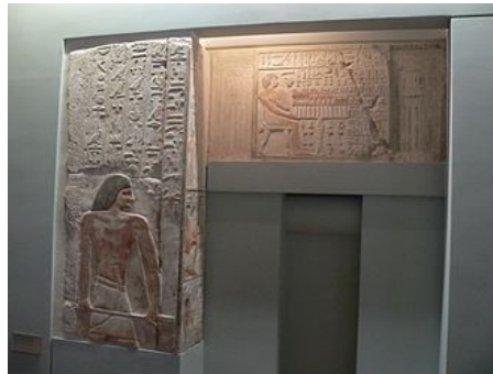
Stèle fausse porte de Méry - IV e dynastie