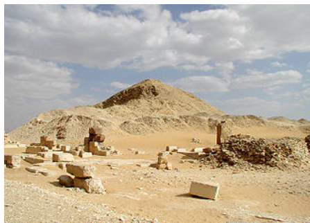
Vue de la pyramide de Pépi II - VI e dynastie