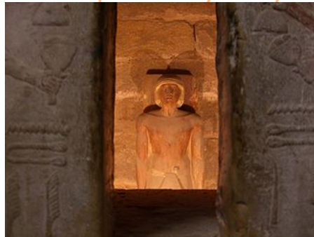
Serdab du mastaba de Ti - V e dynastie