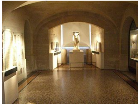
Salle du Sérapéum au musée du Louvre

Anubeïon - Bubasteion - Sérapéum - Iséum