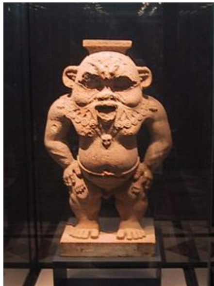
Statue du dieu Bès trouvée au Sérapéum - XXX e dynastie