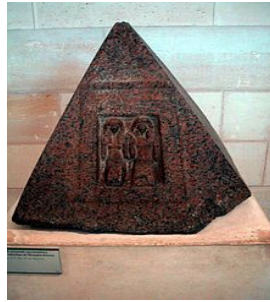
Pyramidion du grand intendant de Memphis Iniouia - XVIII e dynastie