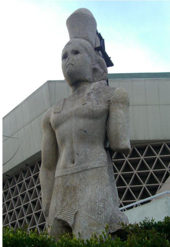
Statue de Ptolémée II érigée à l'origine à la porte du phare d'Alexandrie, récupérée des eaux et désormais devant la Bibliotheca Alexandrina

d'entrepôt, il se terminait par une plateforme décorée de tritons. Le deuxième étage, haut de plus de 30 mètres, était de forme octogonale; le troisième de forme cylindrique, d'une dizaine de mètres possédait une lanterne ou un foyer alimenté par un feu permanent, placés sous un dôme porté par huit colonnes. Au-dessus du dôme s'élevait une statue de bronze de sept mètres de hauteur, censée représenter Poséidon. Le phare fut entretenu ou restauré successivement par Cléopâtre, l'empereur Anastase Ier et Ibn Touloun vers 880 de notre ère. Trois séismes survenus au VIII e siècle, au XII e siècle, enfin au XIV e siècle, ainsi que les canons des Mamelouks vinrent à bout du prestigieux monument et le détruisirent. En 1480, le sultan mamelouk Qaït Bey (1468-1496) y construisit un ouvrage de défense côtière.