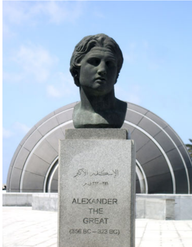
Le buste d'Alexandre le Grand sur le parvis de la Bibliotheca Alexandrina

Une île il y a dedans la mer profonde Tout vis-à-vis de l'Égypte féconde, Qui par son nom Pharos est appelée." Plutarque, La Vie des grands hommes, "Alexandre le Grand"