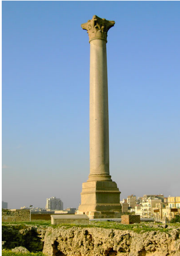
La colonne Pompée