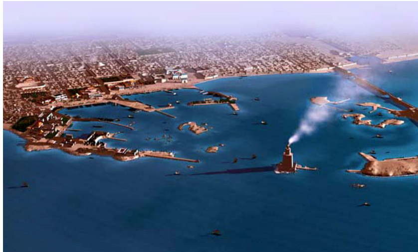
Reconstitution de la ville antique. Au premier plan, le célèbre phare

Quelques mois plus tard, Alexandre, préoccupé par ses guerres contre les Perses, quitta l'Égypte précipitamment et se dirigea vers l'Orient pour atteindre les rives de l'Indus (Pakistan actuel), non sans fonder d'autres villes, toutes baptisées Alexandrie. Il ne revint plus jamais en Égypte.