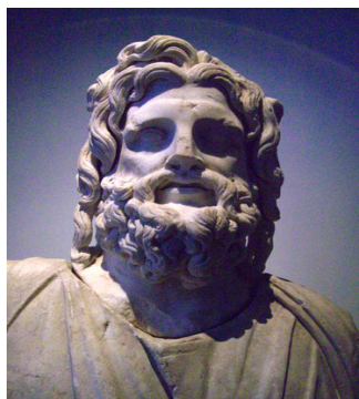
Le dieu Sérapis

C'est Ptolémée I er (305-284 av. J.-C.) qui introduisit à Alexandrie le culte de Sérapis, divinité syncrétique qui associa les dieux Osiris et Apis à Zeus, Dionysos et Asclépios. C'est pour Sérapis que fut construit le Sérapéum dont la renommée s'étendait au delà de la ville, dans l'Antiquité. Le temple dressé sur une plate-forme s'élevait à la périphérie de la ville sur une éminence; un escalier de cent marches y conduisait. Des cours ouvertes entouraient le temple. La statue de Sérapis sculptée par Bryaxis représentait le dieu assis sur un trône, vêtu d'un long vêtement. Sa tête bouclée et barbue portait comme coiffure, un calathos (une sorte de vase). De la main gauche, il tenait un long sceptre; sa main droite était posée sur le chien des enfers à triple tête, nommé Cerbère, étendu à ses pieds. De même qu'au temple de Ramsès II à Abou Simbel, l'architecte avait construit le temple de telle sorte que les rayons du soleil du matin atteignent le sanctuaire lors des solstices, ici le soleil atteignait les lèvres de la statue de Sérapis et les illuminait.