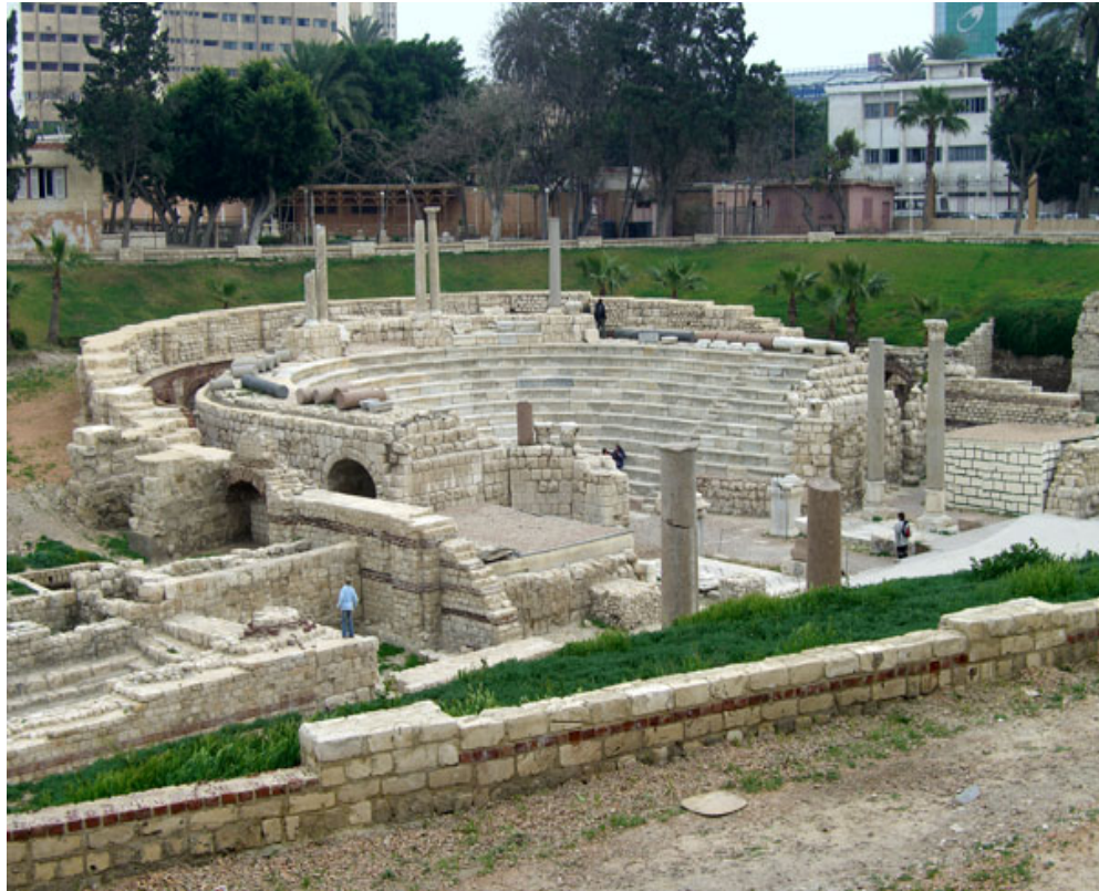
Le théâtre romain de Kôm ed-Dikka

On peut rappeler que le théâtre fut l'un des principaux divertissements d'Alexandrie et que de nombreux textes marquent l'importance des troupes d'acteurs dans la cité tandis que les arts plastiques offrent de précieux renseignements sur la vie théâtrale. Dionysos d'ailleurs, occupe une place importante dans le panthéon alexandrin. De plus, le Musée gréco-romain présente de nombreuses compositions en terre cuite représentant des acteurs au masque stylisé