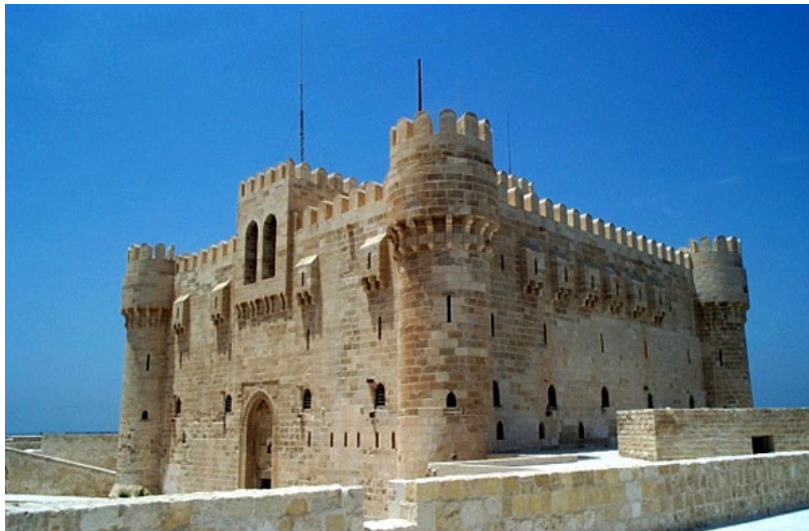
Le fort de Qaït Bey érigé au XV e siècle par le sultan Qaït Bey avec les pierres du phare de l'île de Pharos

Le fort abrite un petit musée naval avec un petit diaporama évoquant les expéditions pharaoniques au Liban; la copie d'un bas-relief du Ramesseum relatant une bataille contre "les peuples de la mer"; des souvenirs de la bataille d'Aboukir; des armes ottomanes...Du fort, jolie vue sur la corniche et sur le port de pêche.