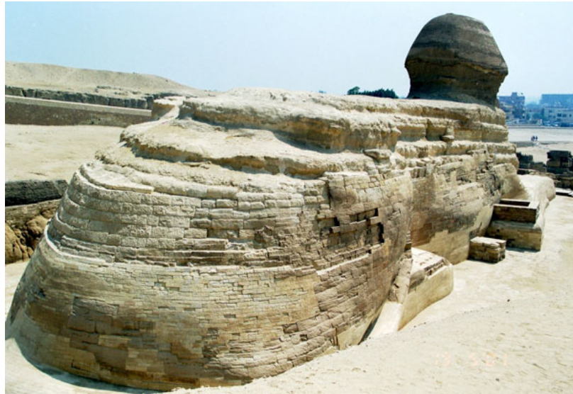
Le Sphinx fait face à l'est

Aujourd'hui la pollution et l'érosion éolienne dégradent la pierre; de plus le calcaire marneux est très sensible à l'humidité et la nappe phréatique est menaçante. Une partie de l'épaule droite s'étant effondrée en 1988, son cou étant fragile. Des travaux pour sauver le Sphinx furent entrepris dès 1989 et durèrent huit ans.