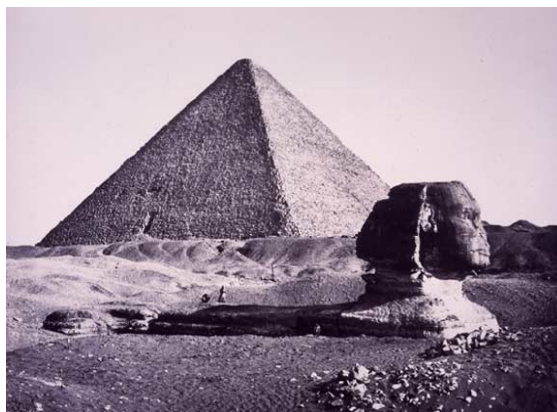
Le Sphinx ensablé devant la pyramide de Khéops en 1870

Plusieurs fois, le Sphinx "à la face camarde" dut être décaqué des sables envahissants; Mariette entreprit de le