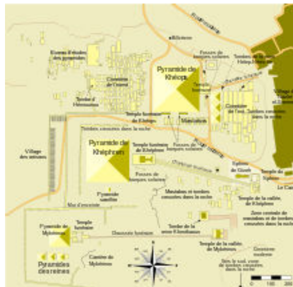
Plan du plateau de Gizeh

Une nouvelle théorie tendrait à rapprocher Anubis et le Sphinx de Gizeh : En 2009, Robert et Olivia Temple publient un livre intitulé The Sphinx Mystery dans lequel ils avancent qu'à l'origine, le Sphinx était probablement une monumentale représentation du dieu Anubis taillée dans la roche pendant l'Ancien Empire.