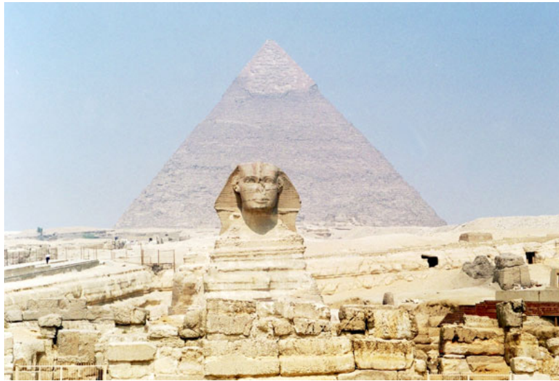
Le Sphinx devant la pyramide de Khéphren

Le sphinx de Gizeh (appelé par les Arabes أبو الهول Abou al-Hôl , « père de la terreur ») est la statue thérianthrope qui se dresse devant les grandes pyramides du plateau de Gizeh, en amont du delta du Nil, dans la Basse-Égypte. Sculpture monumentale monolithique la plus grande du monde elle représente un sphinx couchant.