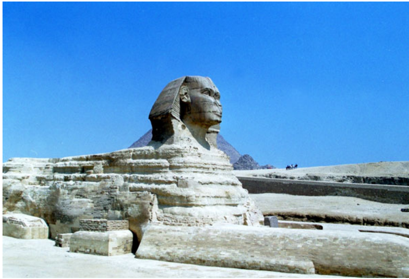
Le Sphinx érodé avec entre ses pattes la stèle de Thoutmosis IV

Le Sphinx était considéré comme une image du dieu solaire Rê-Horakhty ou Hor-em-Akhet (Horus dans l'Horizon, Harmakhis en grec). Mais son prestige devint tel que d'autres divinités lui furent assimilées et qu'il reçut rapidement un culte important pour lui-même (d'où la construction de temples, tout proches, qui n'ont rien à voir avec les complexes des pyramides).