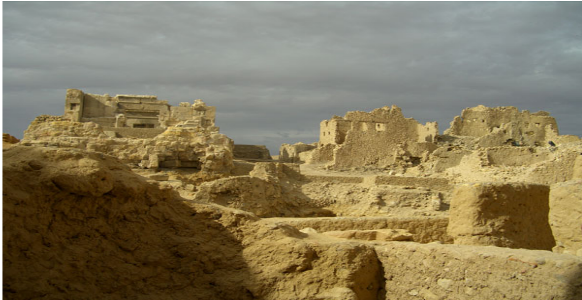
L'acropole d'Aghourmi avec à gauche le temple de l'oracle.

Le temple était célèbre dans tout le monde méditerranéen. On y accédait par le sud par une première cour en pente, construite dans l'axe du temple. Au départ de cette pente se trouve un puits. Là se tenaient les processions; il ne reste que quelques fondations de cette cour. Une fois la cour franchie, on parvenait devant une façade de style égyptien, hellénisée par l'ajout de deux colonnes doriques à cannelures, dont celle de droite est manquante. On arrivait aux parties couvertes de l'édifice : vestibule et sanctuaire (ou cella ) avec salle de "sacristie" où se déroulaient les procédures oraculaires en présence du consultant et des prêtres d'Amon. La salle était couverte d'un double plafond en bois. Un prêtre venait se placer dans l'espace libre, avant la cérémonie, il pouvait accéder à l'aide d'un escalier au faux plafond, par une galerie en forme de L entourant l'angle nord-est de la salle de l'oracle (comme à Karnak et à Kôm Ombô). À droite du sanctuaire une petite crypte dotée de trois niches servait d'entrepôt aux objets de culte.