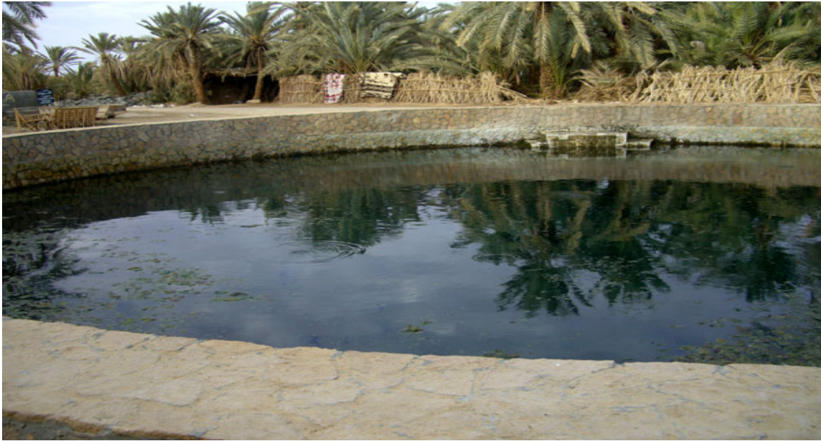
Le "bain de Cléopâtre".

Les nombreux lacs de l'oasis offrent des points de vue magnifiques pour assister au coucher de soleil.