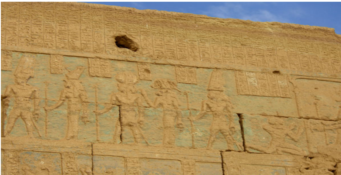
Les bas-reliefs du temple d'Amon : à droite, le gouverneur de Siwa, Ounamon, est agenouillé devant Amon-Rê, précédé de sept divinités.

En contrebas et à proximité du temple de l'oracle, se trouve le temple d'Amon à Oum Oubeyda. Le temple fut en bon état jusqu'au début du XIX e siècle; les gravures publiées par le consul de Prusse en Egypte, le baron Minutoli, sont précieuses car elles montrent des cartouches de Nectanebo II. Un tremblement de terre endommagea le temple en 1811 ; en 1897 on le fit sauter à la poudre à canon pour construire un poste de police et l'habitation d'un notable. Il reste une paroi du fond du sanctuaire avec de beaux reliefs. Le mur est couvert à la partie supérieure d'inscriptions hiéroglyphiques ("rituel de l'Ouverture de la bouche", ce qui est assez rare sur les murs d'un temple, puis de trois registres. De haut en bas, sur la première rangée : à droite, le gouverneur de Siwa, Ounamon, est agenouillé devant Amon-Rê, précédé de sept divinités. Sur la rangée inférieure, de droite à gauche : Atoum, Chou, Tefnut, Seth, Geb, Nout et une divinité non identifiable. Sur le registre inférieur, on reconnaîtra le dieu-faucon Horus parmi huit divinités appartenant à l'Ennéade, avançant vers la droite. Au registre du bas, trois personnages se dirigent vers la gauche. Le reste de l'édifice a disparu; le mur est entouré de blocs épars, de linteaux brisés et de fragments du temple.