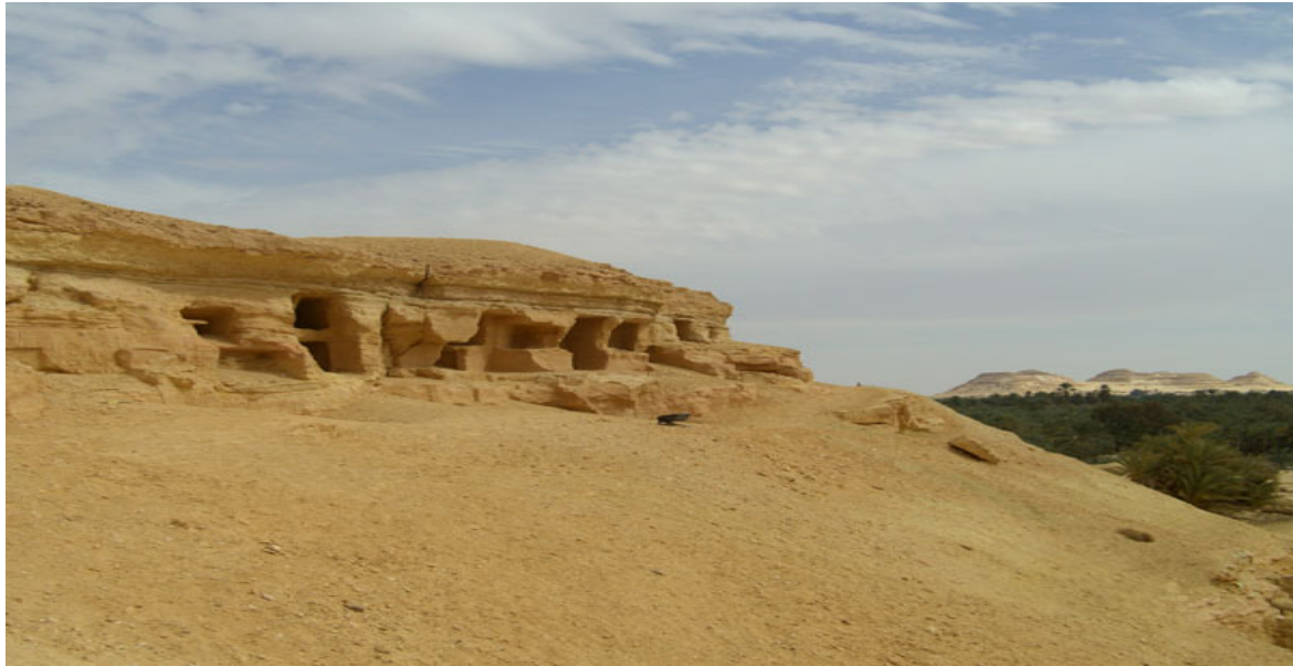
La colline des morts.

La tombe de Si Amon conserve des peintures de style égyptien, très influencées par l'art hellénistique, bien conservé. Une partie de ces peintures fut vendue aux soldats entre 1940 et 1942. Le défunt, d'origine grecque (certainement cyrénéenne), cheveux bouclés et portant barbe et moustache (ce qui est contraire à l'usage égyptien), est représenté avec son épouse et ses deux fils; il est honoré par les dieux égyptiens. Le traitement de son visage évoque certaines peintures du Fayoum. À l'entrée, à droite, splendide représentation de Nout, déesse des ténèbres, représentée auréolée par le feuillage d'un sycomore. Nout présente dans sa main droite de l'encens et du pain; sa main gauche porte un vase d'où s'écoule une chaîne d' ankh (signes de vie) entre deux jets d'eau. La déesse-ciel est également représentée sur le plafond, donnant naissance au soleil et soutenant le ciel étoilé orné de rangées de faucons et de vautours aux ailes déployées. Au fond de la tombe, à droite, la paroi est inachevée et porte des petits carreaux où la tête occupe un rapport de 2/21 e . La tombe fut remployée à l'Époque romaine comme l'attestent des graffiti grecs datés du I er siècle de notre ère.