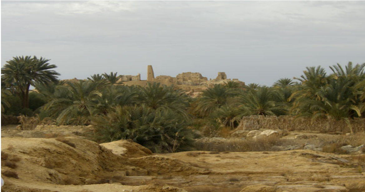
L'acropole d'Aghourmi et le temple de l'oracle depuis le temple d'Amon en contrebas.

premier prêtre qui l'accueille par ces mots prononcés en grec : "Je te salue, mon fils ! Et reçoit ce salut comme venant du dieu. - J'accepte ce titre, mon père, répond Alexandre. Et désormais je m'appellerai ton fils." Si ces propos sont rapportés par les compagnons d'Alexandre ; on ne sait pas grand chose, en revanche, de la consultation de l'oracle proprement dite, car le Macédonien devra suivre, seul, le Premier prêtre à l'intérieur du sanctuaire où une voix invisible répondra à ses questions. Officiellement, le dieu annoncera à Alexandre qu'il est "fils du dieu" mais l'entretien privé demeurera secret. Alexandre confia à sa mère Olympias que l'oracle lui avait tenu des propos confidentiels qu'il lui communiquerait de vive voix à son retour en Macédoine. Il n'en eut pas le temps mais ce qu'on sait, c'est qu'il demanda à être inhumé à Siwa, auprès de son "père" Amon mais qu'aucune attestation de son nom à Siwa ne marque son passage.