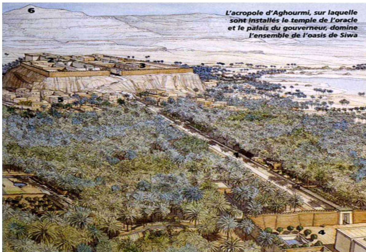
L'acropole d'Aghourmi, sur laquelle sont installés le temple de l'oracle et le palais du gouverneur, domine l'ensemble de l'oasis de Siwa