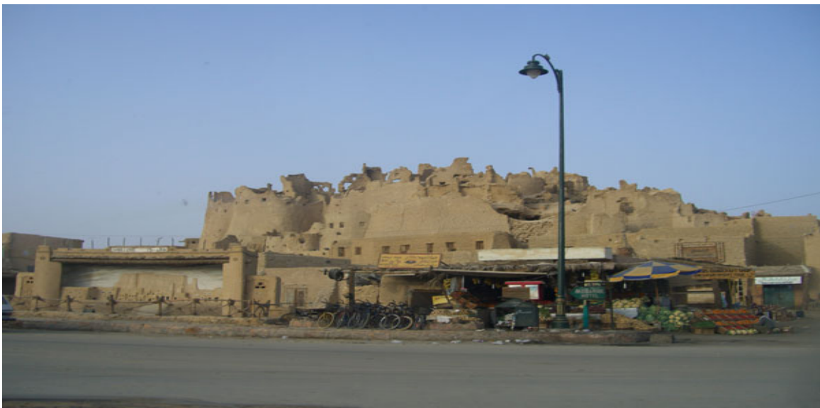
Les ruines de la forteresse de Shali.

La ville est dominée par l'imposante forteresse de Shali , ("ville" en berbère), construite au VII e siècle, reconstruite en 1203 suite à une attaque de Bédouins. Construite en terre, elle est devenue une ville fantôme survolée d'oiseaux noirs, un décor fantastique. Sa particularité est d'être construite à partir de blocs de sel et de rochers enduits de glaise. Shali comportait cinq niveaux mais elle fut presque désagrégée en 1926 par des pluies violentes qui durèrent trois jours. Les habitants l'abandonnèrent pour s'installer dans la ville moderne actuelle, emportant portes et fenêtres en bois de palmier. Il subsiste le minaret de la mosquée, en karshif (mélange de terre et d'eau salée).