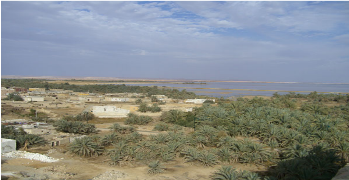
Vue depuis la terrasse du temple de l'oracle.

De la terrasse du temple, belle vue sur l'ancienne ville, le grand lac, la palmeraie, le Gebel el-Mawta.